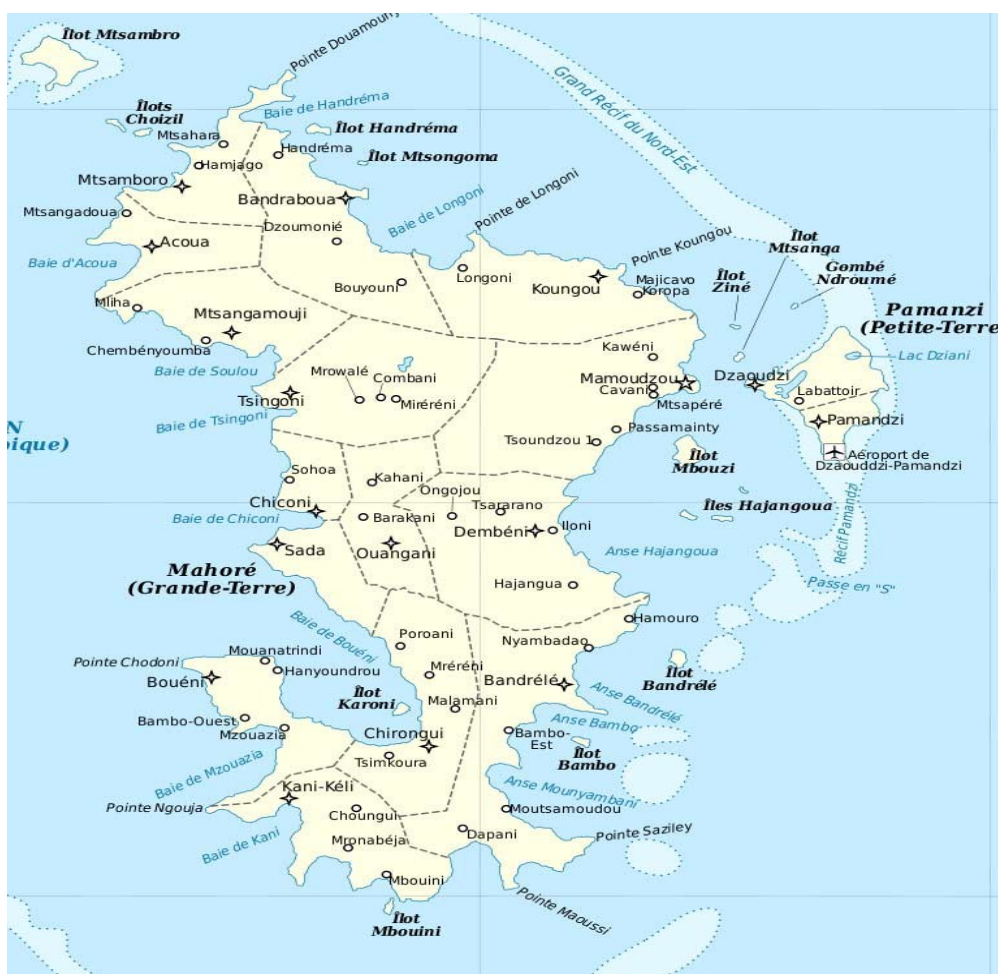
Carte administrative de Mayotte

La vie sociale s'organise autour de 71 villages, la plupart des communes étant composées de 5 ou 6 villages, généralement situés près du littoral. La population des villages est très variable, entre 150 et 11 500 habitants, avec une moyenne aux alentours de 2 600 habitants, et la moitié dans la fourchette située entre 1 000 et 3 500 habitants.