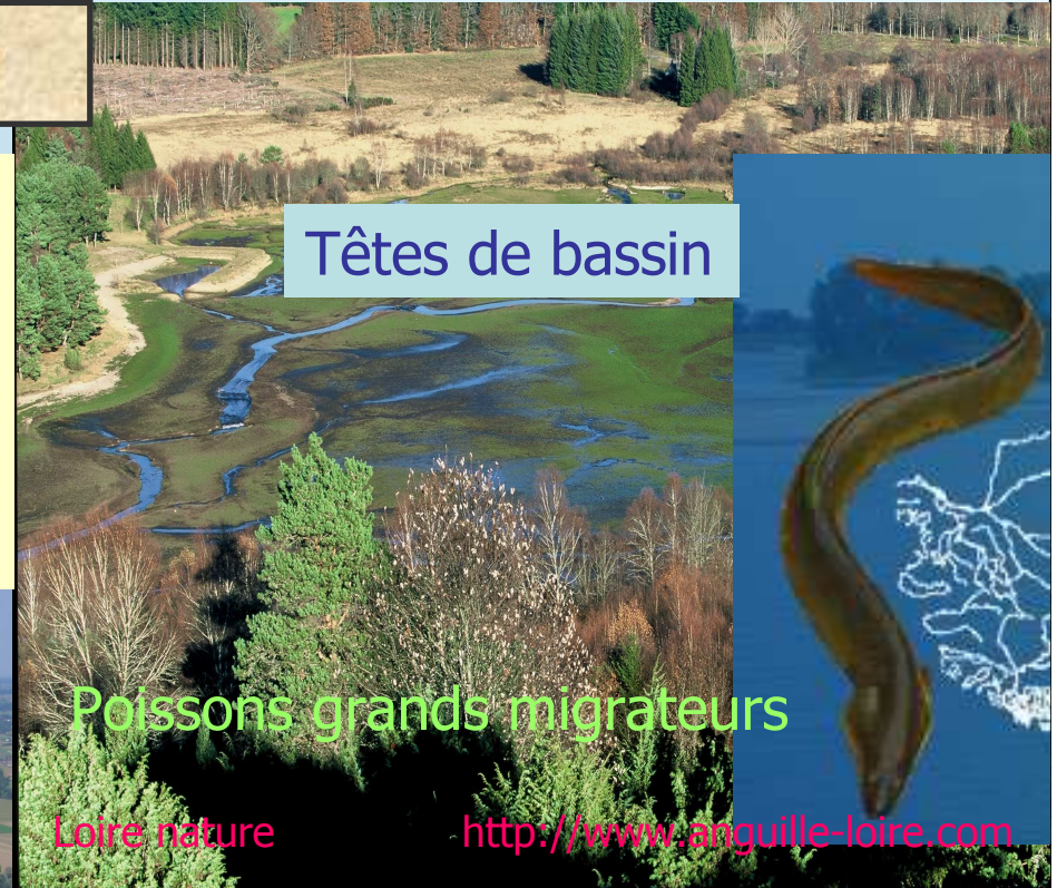
Têtes de bassin

Espace de mobilité des grands cours d'eau